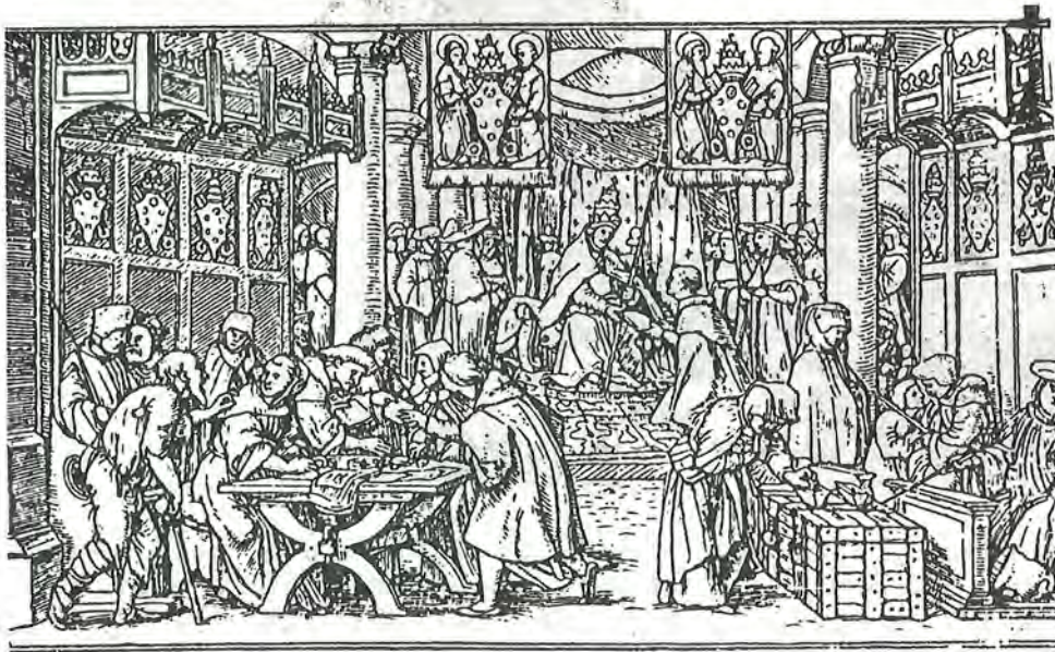
De afluathandel, detail uit een houtsnede van Hans Holbein.