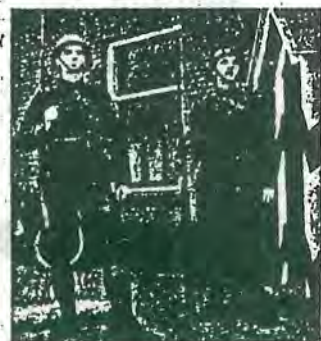
Vannacht komen ze". Schildwachten uit 1939. Wie herinnert zich dit „tafereltje" niet uit die dagen?

De soldaten haastten zich naar de Dam, om daar de eerstvolgende Reederijbus te halen. Het moet wel een potsierlijk gezicht geweest zijn al die mannen met hun soms te krappe uniformen en met van die beenwindsels, de zogenaamde poeties, om hun benen. Na een roerend afscheid van hun gelieven zijn ze afge-reisd richting ... ja, wat stondje te wachten?