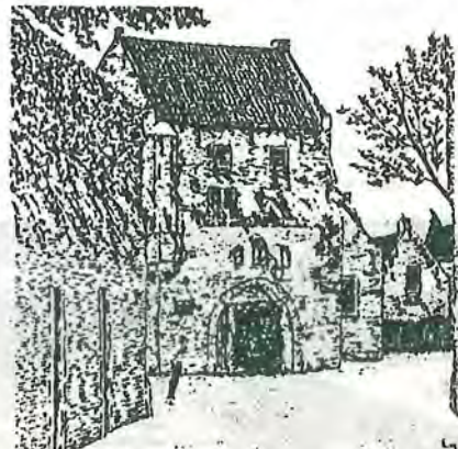
Water- of Gevangenpoort

Samen vloeien. Met Gorinchem en Slot Loevestein vormde het vroeger jarenlang een strategisch belangrijke driehoek, de 'IJzeren Driehoek'.