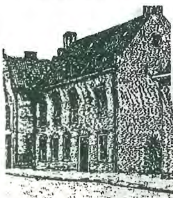
Jacoba van Beieren-huis

Zo ziet u weer: een mens is nooit te oud om wat te leren!