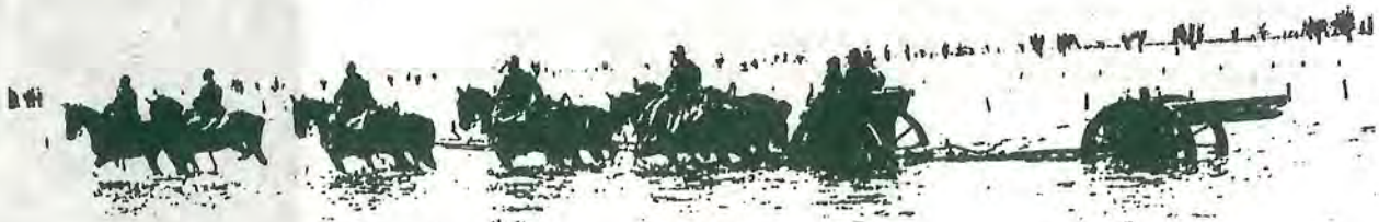
Een batterij veldartillerie trekt het inundatiegebied binnen.