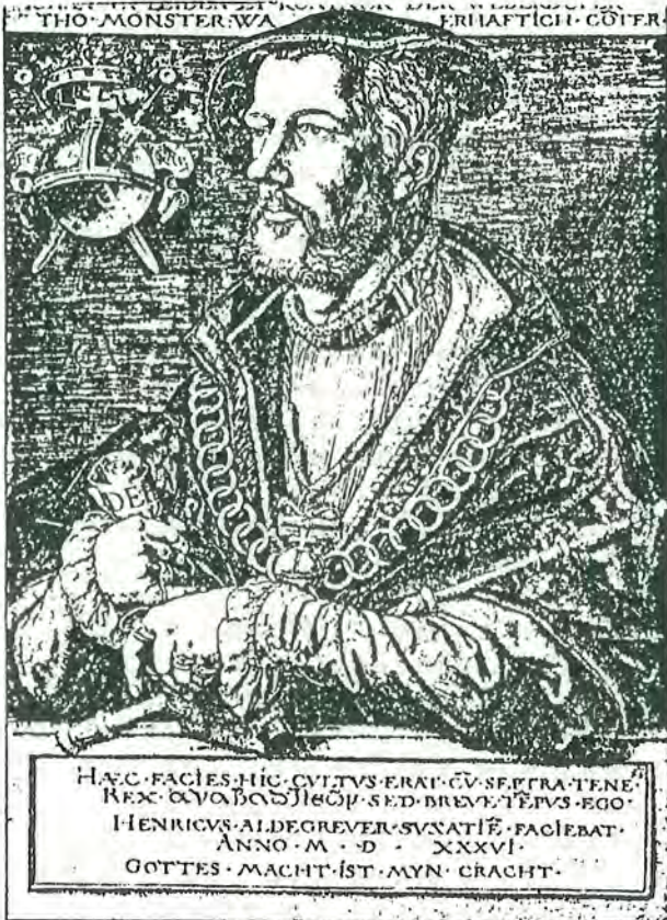
Jan van Leyden, „koning der wederdopers te Munsters”, naar een kopergravure van H. Aldegrever, gemaakt in 1536.

De wederdopers bestonden uit twee groepen, uit fanatieke dweppers, die zich beschouwden als de enig-ware gelovigen, die geroepen waren het Koninkrijk Gods op aarde te brengen en alle ongelovigen te verdelgen. Ze grepen zelfs naar geweld en beriepen zich op het inwendig licht.