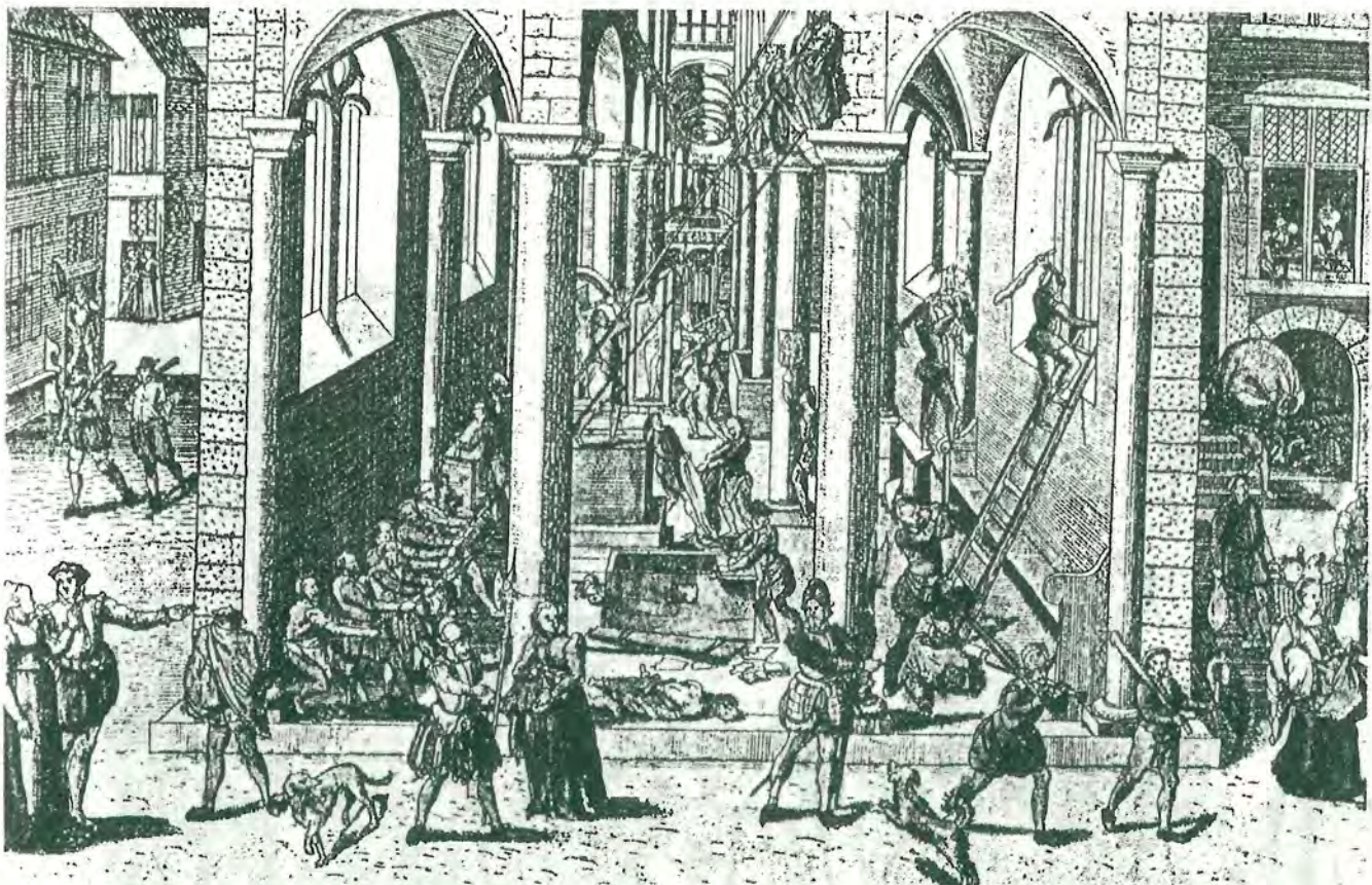
De Beeldenstorm in 1566. Gravure uit 1578 van F. Hogenberg.