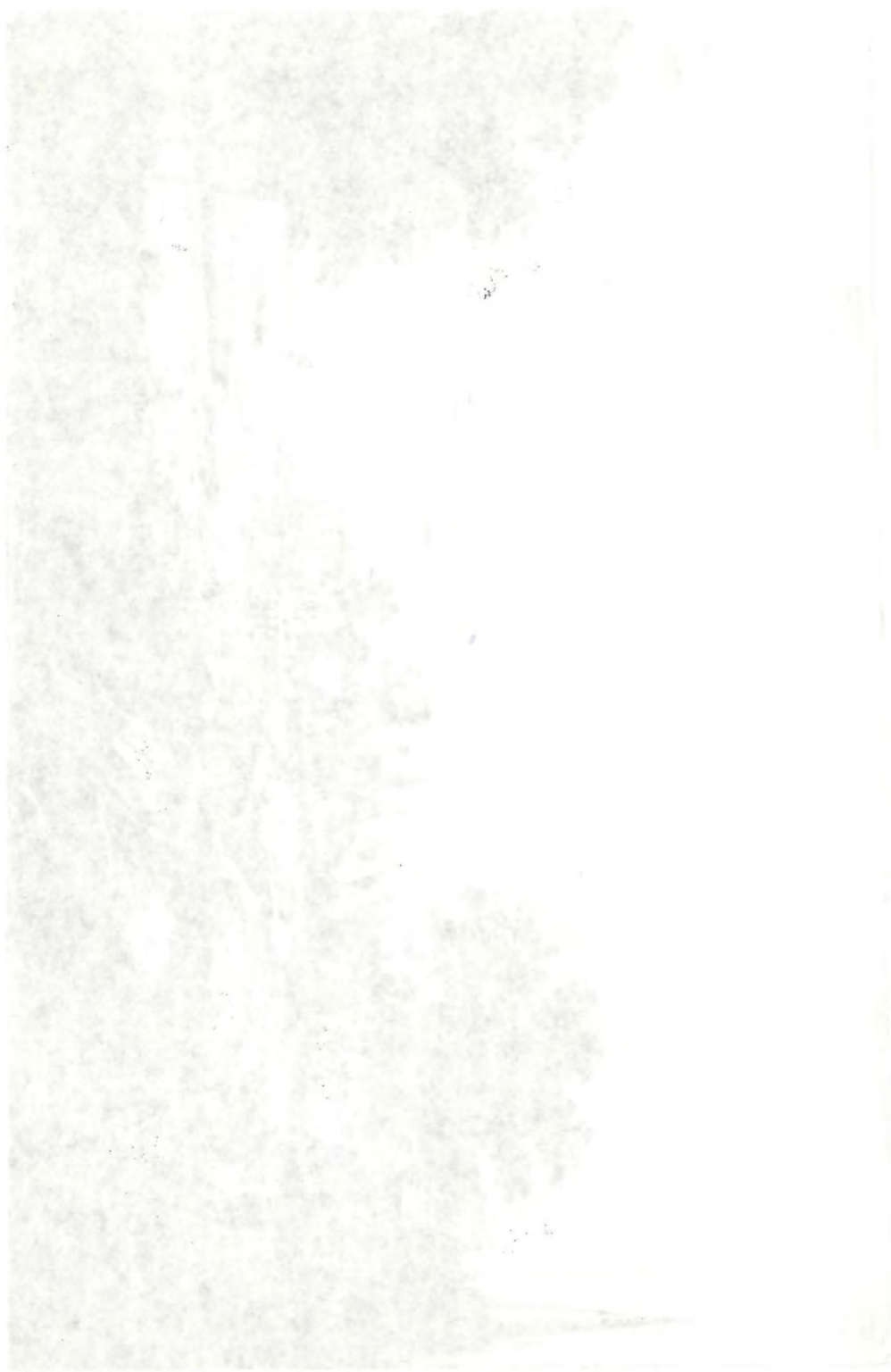
Very faint, illegible text, possibly a caption or description of the photograph above.